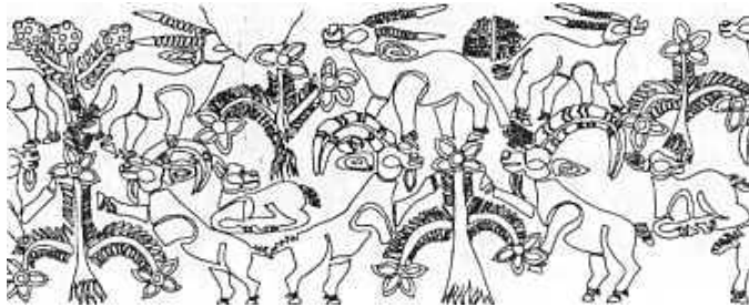
تصویر ۱. سه نقش مایه درخت و حیوان بر روی ظروف تمدن حوزه هلیل‌رود، هزاره سوم قبل از میلاد (طرح از یوسف مجیدزاده)

همچنان که در تصویر شماره یک مشاهده می‌شود، بر بعضی از ظروف موزه باستان‌شناسی جیرفت نقش درخت نخل و سایر درختان به همراه حیوانات از جمله شیر و بز نقش بسته است. ۱۰ درصد از نقوش ظروف تمدن حوزه هلیل‌رود را نقوش نباتی و ۱۲