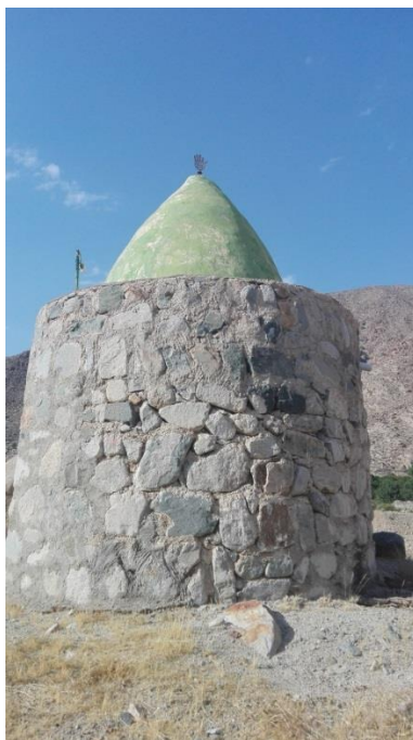
تصویر ۴. قدمگاه به فرم ماندالا

شده‌اند (تصویر ۴). هر بنای مذهبی یا غیرمذهبی که بر مبنای طرح ماندالا ساخته شده، فرافکنی تصویر کهن‌الگویی از ناخودآگاه، به جهان خارج است. شهر، قلعه و یا معبد هر کدام نماد وحدت روانی می‌شوند و بدین‌سان بر روی افرادی که وارد آنها می‌شوند و یا در آنها زندگی می‌کنند تأثیری خاص می‌گذارد (یونگ، ۱۳۷۸: ۳۷۱). قدمگاه، زیارتگاه و نظرگاه به عنوان مکان‌های مقدس در بیشتر موارد بر فراز بلندی کوه و تپه، یا در مکانی نزدیک به کوه بنا شده‌اند و دلیل آن این است که این‌گونه فضاها در مرکز توجه و جهان‌بینی قرار بگیرند و از این منظر به عنوان مکان وحی، شهود، تجلی‌گاه الوهیت و نماد قدرت به شمار بروند (Mei, 1986, Vol 14: 130-132). فضای زیارتگاه‌های این حوزه، معنوی و اثرگذار هستند به گونه‌ای که هنگامی که فرد عامی وارد این مکان می‌شود زندگی مادی را فراموش می‌کند و با ذکر دعا و نیایش به یک وحدت درونی می‌رسد. خادم زیارتگاه یا (شیخ) پس از نظافت، در محراب زیارتگاه چراغ یا شمع روشن می‌کند و با خواندن دعا شرایط را برای فرو رفتن در اندیشه ژرف مهیا می‌کند. این امر سبب دگرگونی شخصیت فردی مطابق با نظریه فرایند فردیت یونگ می‌شود.