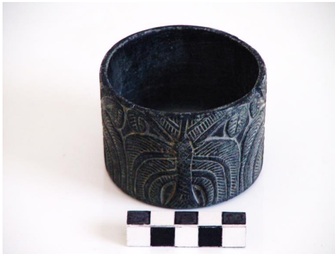
تصویر ۲. ظرف گلریتی منقوش به درخت نخل، یافت شده از حوزه فرهنگی هلیل‌رود (موزه باستان‌شناسی جیرفت)

درصد را نقوش گیاهی تشکیل داده‌اند که حاکی از احترام به گیاهان و درختان در باور مردمان حوزه هلیل‌رود است (Basafa and Mohammad Hosein Rezaei, 2014). به نظر می‌رسد که احترام به درخت و به خصوص درخت نخل برای مردم حوزه هلیل‌رود از نوع احترام به درخت زندگی در میان‌رودان باشد. زیرا در منطقه میان‌رودان برخی درختان به دلیل طول عمر و زیبایی، سودمند و مقدس هستند. از جمله این درختان می‌توان به درخت سدر، تاک، انار و نخل اشاره کرد. همچون حوزه هلیل، درخت نخل در میان‌رودان نیز غالباً بین دو محافظ با هیبت شیر ترسیم شده است (هینلز، ۱۳۸۳: ۴۶۱).