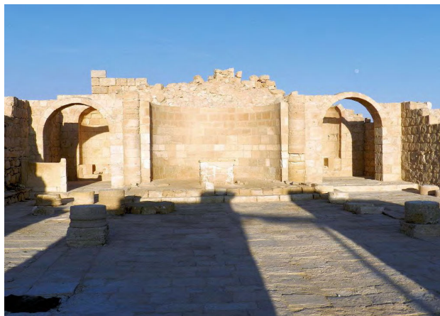
صحنه هاجیوس تنودوروس (Hagios Theodoros) که در آوادات/اوبودا در ۶۱۷م کنده شده است. (Reynolds, 2013: 124)

فصلنامه علمی تاریخ اسلام و ایران دانشگاه الزهراء(س)، سال ۳۲، شماره ۵۳، بهار ۱۴۰۱ / ۵۱