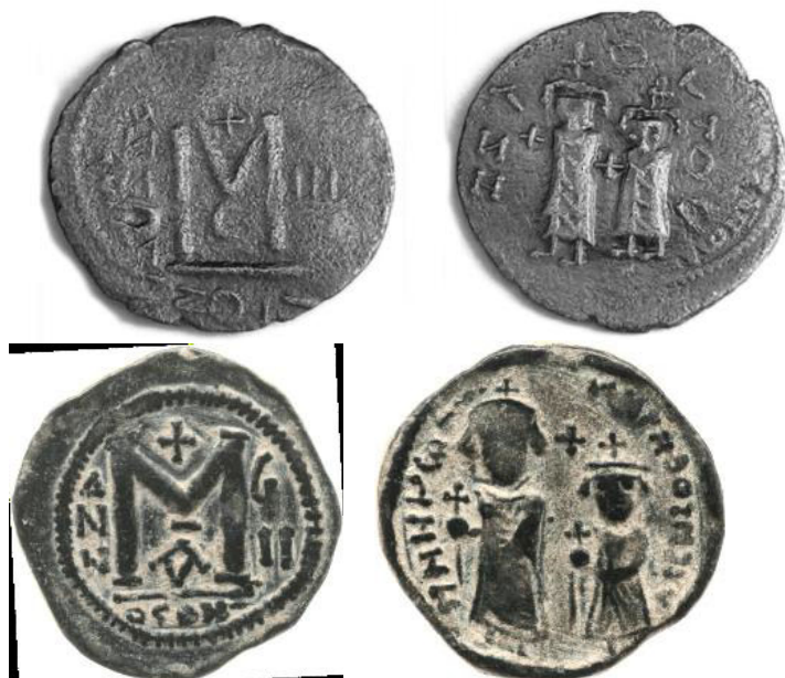
سکه تقلیدی، تصویر هراکلیوس و پسرش کنستانتیوس را دارد (Pottier, 2010: 468; Pottier, and Foss, 2004: 282)