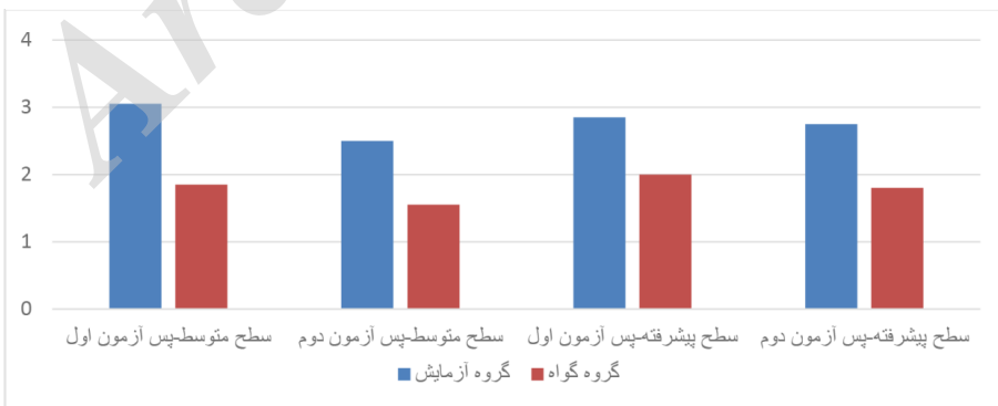
شکل ۳: عملکرد گروه‌ها در زمین‌ه دقت در گفتار در پس‌آزمون‌های اول و دوم