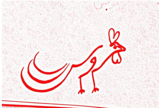
شکل ۳: تصویر خط‌نقاشی «نقاشی خروس»

برای نمونه در تصویر بالا، «نقاشی خروس» بازنمونی است که در درون‌داد اول قرار دارد و «تفسیر عینی خروس» در درون‌داد دوم. «واژه خروس» که به صورت خط‌نقاشی در لابه‌لای تصویر ادغام شده‌است، در درون‌داد سوم قرار دارد. درون‌داد دوم (تفسیر) با درون‌داد سوم (به‌مثابه بازنمونی که به صورت واژگانی است) فضای آمیخته نمادین تشکیل می‌دهد ولی با درون‌داد اول (به‌مثابه بازنمونی که به صورت نقاشی است) فضای آمیخته شمایی می‌سازد. این فضاها جدا جدا پردازش نمی‌شوند، بلکه به صورت پویا و همزمان پردازش می‌شوند و تشکیل یک سوژه آمیخته چندگانه می‌دهند.