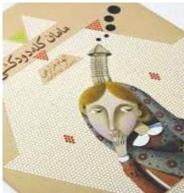
شکل ۱: تصویر سوژه «مامان کله‌دودکشی»

آمیخته درزمانی: عنصر کانونی حوزه‌های درون‌داد، یک رابطه توالی زمانی نیز نسبت به هم دارند، مانند سوژه‌ای که دچار دگردیسی شده، یا سوژه‌ای که از جهانی به جهان دیگر انتقال پیدا کرده است (و به تعبیر مک‌هیل ۱ : دچار «همانی تراجهانی» شده است). در داستان «جوجه اردک زشت» (Andersen, 1999)، کانون معنایی درون‌داد اول، یک جوجه‌اردک زشت است و کانون معنایی درون‌داد دوم، یک قوی زیبا. از آن‌جا که جوجه‌اردک زشت در اثر دگردیسی به قو تبدیل شده است، بنابراین فضای درون‌داد دوم (فضای ذهنی مرتبط با قو) در توالی زمانی فضای درون‌داد اول (فضای ذهنی مرتبط با جوجه‌اردک) شکل گرفته است. بنابراین سوژه، پس از دگردیسی، در پایان داستان «جوجه‌اردک زشت» (نه در ابتدای داستان)، در قالب یک فضای آمیخته (با درون‌دادهایی از دو زمان مختلف) درک می‌شود. آمیخته همزمانی: عنصر کانونی دو حوزه درون‌داد رابطه توالی زمانی نسبت به یک‌دیگر ندارند. در «مامان کله‌دودکشی» (Mazarei, 2013) تصویری که در داخل کتاب از سوژه داستان کشیده شده، از تلفیق دو فضای درون‌داد تشکیل شده است که در یکی کانون معنایی، «مامان» است و در دیگری «دودکش».