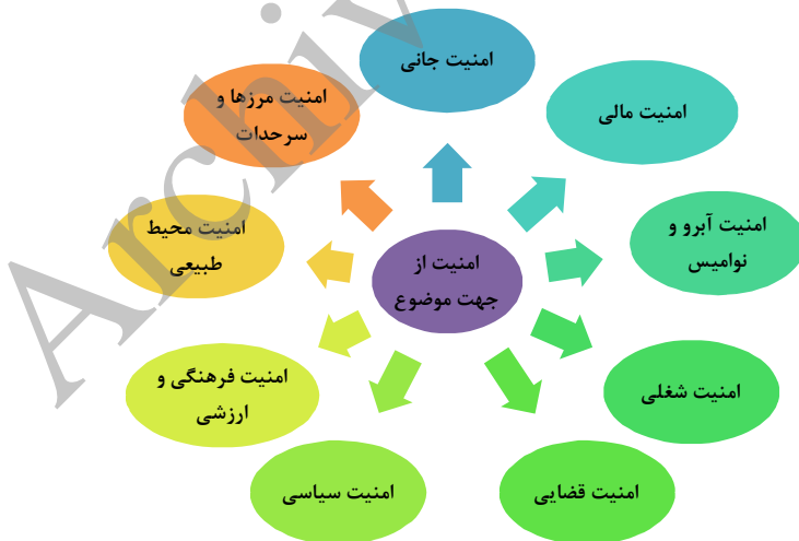
نمودار ۱: امنیت از منظر موضوع

امنیت مرزها و سرحدات: عبارت است از فقدان اضطراب و تهدید از هر گونه تهاجم و تجاوز نظامی کشورهای بیگانه به مرزها و سرحدات کشور (دلاور و رضایی، ۱۳۸۴).