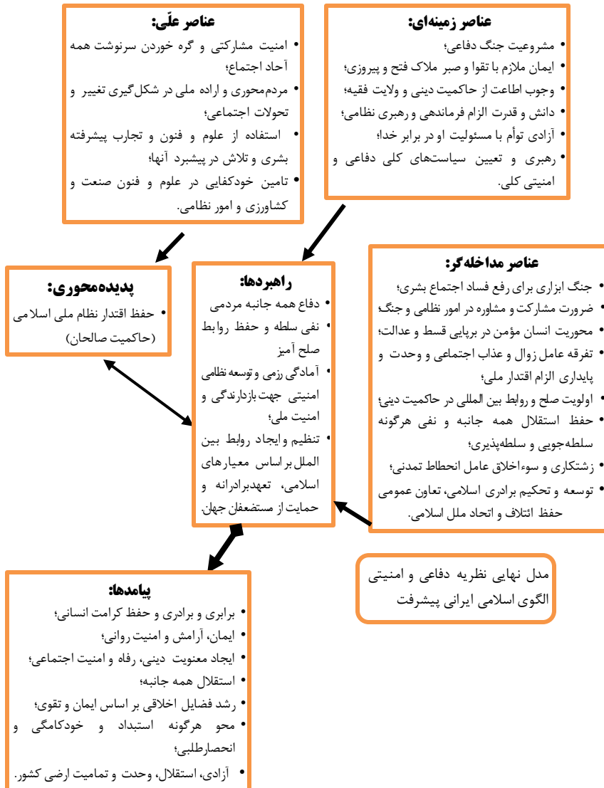
شکل ۲: مدل نهایی نظریه دفاعی و امنیتی الگوی اسلامی - ایرانی پیشرفت