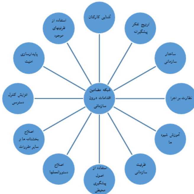
شکل ۱: شبکه مضامین تشکیل‌دهنده مقوله «اقدامات درون‌سازمانی»