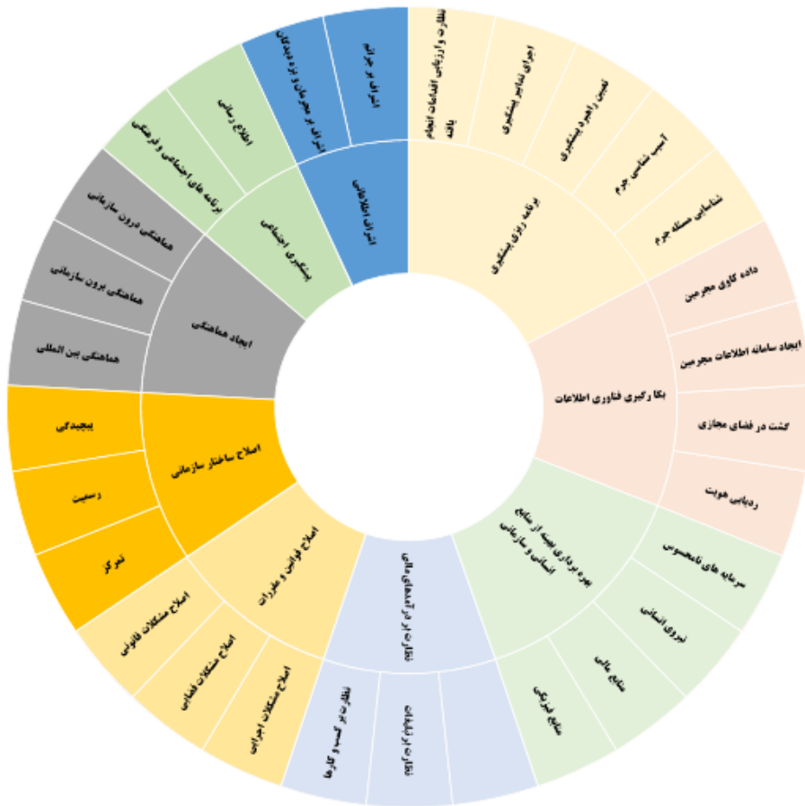
شکل ۱: شبکه ابعداد و مؤلفه‌های پیشگیری از جرائم منافی عفت و اخلاق عمومی در فضای مجازی