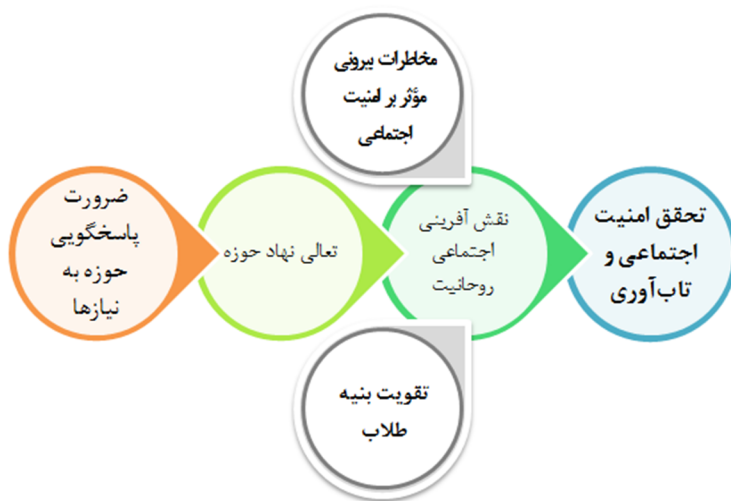
شکل 2: مدل نظریه نقش آفرینی نهاد روحانیت در ارتقای تاب‌آوری و امنیت اجتماعی

در ابتدا، پس از کندوکاوهای فکری فراوان به‌منظور یافتن جایگاه نقش آفرینی نهاد روحانیت، این طبقه به‌عنوان طبقه راهبردها و کنش‌ها مطرح شد. در همین راستا، یافتن شرایط موردنیاز و همچنین هسته مرکزی بحث، فکر پژوهشگران را به خود جلب کرد. باید به این نقش آفرینی به‌مثابه اقدامی که قرار است طلاب انجام دهند، نگاه کرد. این نقش آفرینی اقدامی مستمر و به‌مثابه هوا برای ساختن جامعه‌ای سعادتمند است. نظریه نقش آفرینی نهاد روحانیت، شرایط لازم و طبقه محوری لازم برای انجام آن و پیامدهای ناشی از آن را توضیح می‌دهد. درواقع، سؤال اصلی پژوهش این بود که چه نظریه‌ای نقش آفرینی نهاد روحانیت را تبیین می‌کند؟