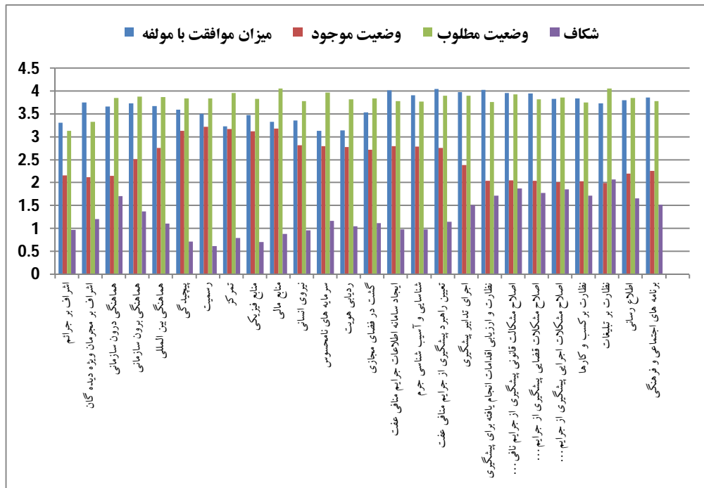
نمودار 1: میزان موافقت، وضعیت موجود، وضعیت مطلوب و شکاف مؤلفه‌ها