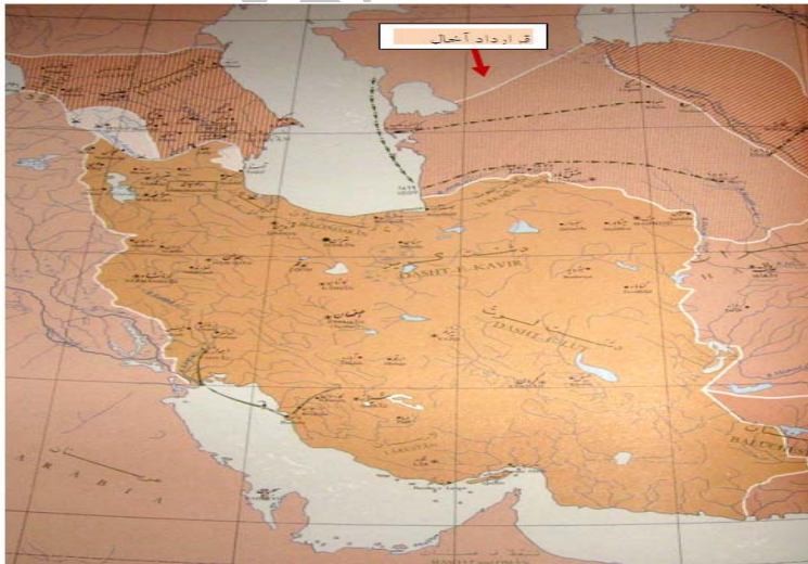
شکل (۱) نقشه سرزمین‌های جدا شده از ایران طبق قرارداد آخال (آخال - تکه)

پیمان آخال تأثیر دوگانه‌ای بر ایران داشت. از یک سو ایران تا حدی از یورش‌های ترکمن‌ها رهایی می‌یافت اما این امر به بهای گران از دست رفتن سرزمین‌هایی به‌دست آمد که ناصرالدین‌شاه ادعای سلطنت بر آن‌ها داشت (میرحیدر، ۱۳۵۶: ص ۱۸۵). این پیمان همچنین به ضرر ایلات و عشایر ترکمن‌ها بود و با مصالح سنتی قوم ترکمن هم‌خوانی نداشت. میان آنان مرز کشی شده و در دو کشور جداگانه قرار می‌گرفتند و اتحاد آنان به هم می‌خورد. یموت‌های ایران که بر اساس موافقت‌نامه دو دولت هر سال برای چراندن گله‌های خود به آن سوی مرز کوچ می‌کردند باید به هر دو دولت مالیات می‌دادند و این موضوع مقامات روسی و ایرانی را در جمع‌آوری مالیات دچار مشکل کرده بود.