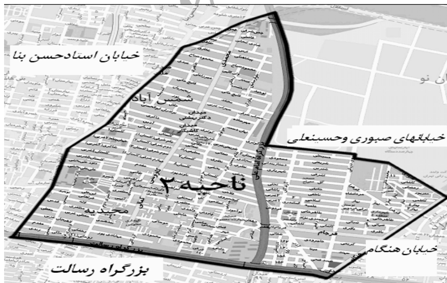
شکل (۱) مرز بندی ناحیه دو (محدوده مورد مطالعه)

این ناحیه متشکل از سه محله با ویژگی های متفاوت تیپولوژیک بوده و از این دیدگاه امکان مناسبی برای مقایسه را فراهم می آورد، به گونه ای که کالاد محله ای ساخته شده بر مبنای طرح و برنامه قبلی است، مجیدیه حاصل گسترش یک هسته روستایی در چهار دهه گذشته است و شمس آباد حاصل گسترش هسته روستایی در دوره اخیرتر است.