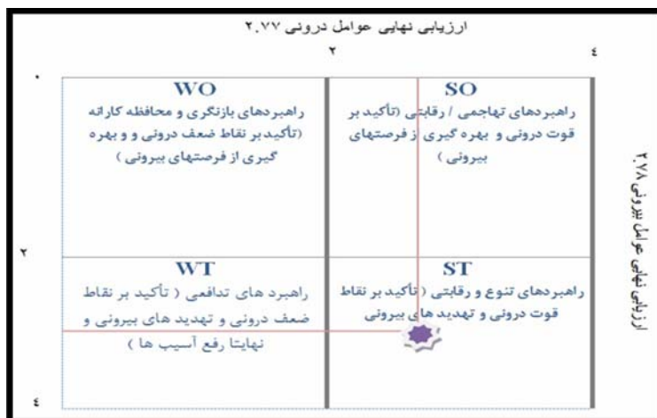
شکل (۲) ماتریس نمره نهایی ارزیابی عوامل داخلی و خارجی (مأخذ: نگارندگان ۱۳۹۰)