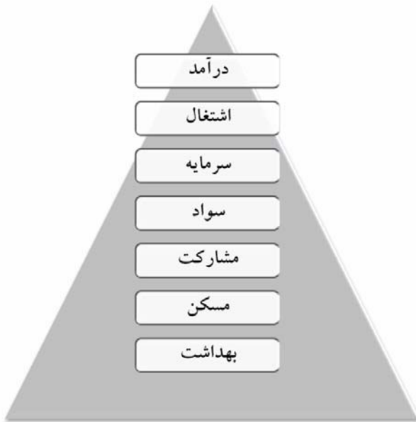
شکل (۳) هرم نیازهای اساسی توسعه روستایی در دهستان شوسف شهرستان نهبندان