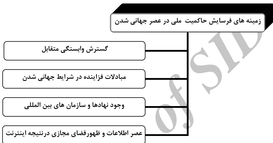
شکل (۳) زمینه های فرسایش حاکمیت ملی در عصر جهانی شدن (ترسیم از: نگارندگان)

قابل پیش بینی در جهت ایفای نقش خود به عنوان یک نهاد تأثیر گذار تداوم پیدا خواهد کرد. اما وجود یا فقدان حاکمیت به صورتی هر چه کمتر ویژگی تعیین کننده ساختار یا شیوه عمل دولت خواهد بود (کلرک، ۱۳۸۲: ۱۷۳). (شکل ۳)