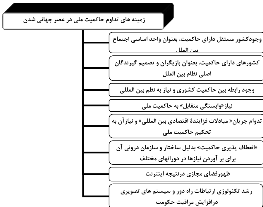
شکل (۲) زمینه های تداوم حاکمیت ملی در عصر جهانی شدن (ترسیم از: نگارندگان)

همچنین، برخی مانند «تامسون» و «کراسنر» با زیر سوال بردن این ادعا که «وابستگی متقابل»، حاکمیت را تهدید می کند، استدلال می کنند که وابستگی متقابل به جای تهدید حاکمیت، خود نیازمند آن است. حکومتهایی دارای حاکمیت هستند که به تضمین و تثبیت حقوق مالکیت می پردازند و این خود، از شرایط لازم برای جریان بین المللی کالا و سرمایه است. مطابق با این استدلال، تحکیم حاکمیت خود از شرایط لازم برای جریان یافتن مبادلات فزاینده اقتصادی بین المللی است (Thomson and krasner, 1989: 197-198). «تامسون و کراسنر»، بر این اساس، هر گونه امکان بالقوه برای دگرگونی ساختاری عمده را که از پایین در رژیم حاکمیت رخ دهد، رد می کنند (Thomson and krasner, 1989: 216)، زیرا که وابستگی متقابل پیوسته نیازمند «تداوم» رژیم حاکمیت برای حفظ و پیگیری خود است. «کراسنر» در جای دیگر نیز همین استدلال اصلی را با تفصیلی بیشتر تکرار می کند. به نظر وی شواهد و سابقه تاریخی بسیار پیچیده تر از آن است که با تصور رایج درباره تهدید کنترل موثر حکومتی از جانب وابستگی متقابل مطابقت کند. بدین معنی که، کنترل موثر حکومتی به هر حال در