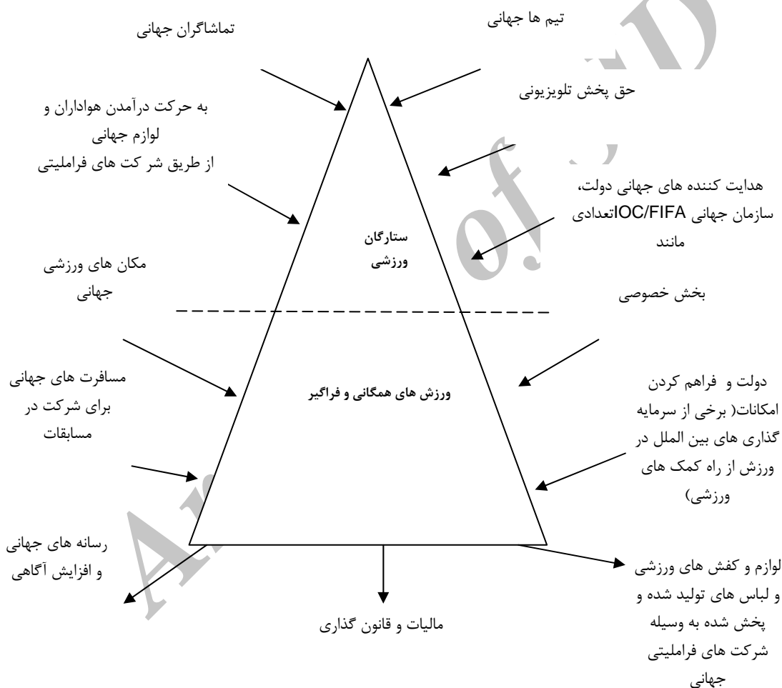
شکل (۱) مدل جهانی شدن ورزش (وارن، ویدریک، ۷۲: ۱۳۸۴)

ساختارهای نظام جهانی ورزش و پویایی آن با طراحی، تنظیم و اقدامات حمایتی و مشارکتی دولت‌ها در کشورهای آمریکای شمالی، ژاپن، اروپای غربی و به طور کلی جهان توسعه یافته و قدرتمند تکوین یافت (Coakley: 2001: 337) و موجب توسعه فضای جغرافیایی و اجتماعی کشورهای مذکور شد و پس از آن در سایر کشورها مورد توجه قرار گرفت.