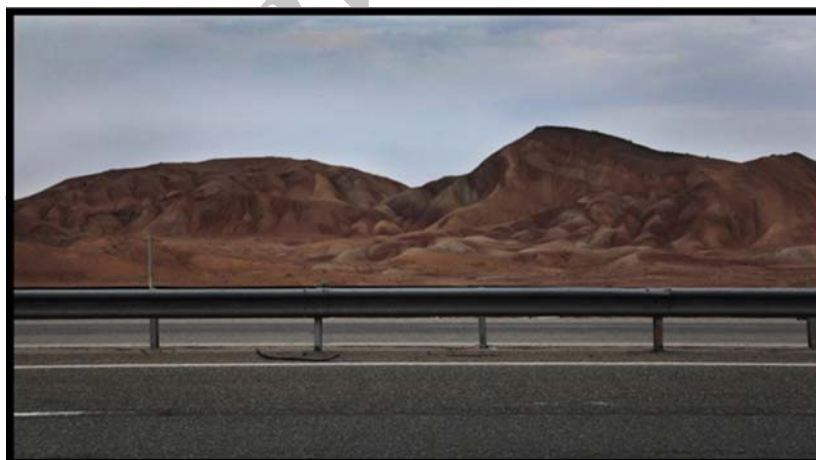
شکل (۵) گنبد نمکی نامنظم در مجاورت آزاراه قم- کاشان

جاذبه ها و قابلیت های گردشگری: آشنایی عموم گردشگران با پدیده های ژئومورفولوژیک و لندفرم های حاصل از تکتونیک نمکی نظیر پدیده ای پای پینگ و غیره؛ جاذبه های آموزشی (تخصصی) در زمینه شناخت تکتونیک، ماگماتیسزم، ژئومورفولوژی ساختمانی و غیره.