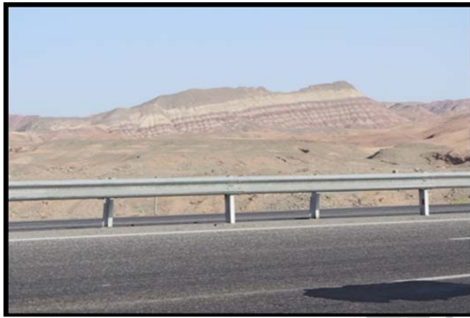
شکل (۲) اشکال چین خورده ترشیاری در تشکیلات تبخیری