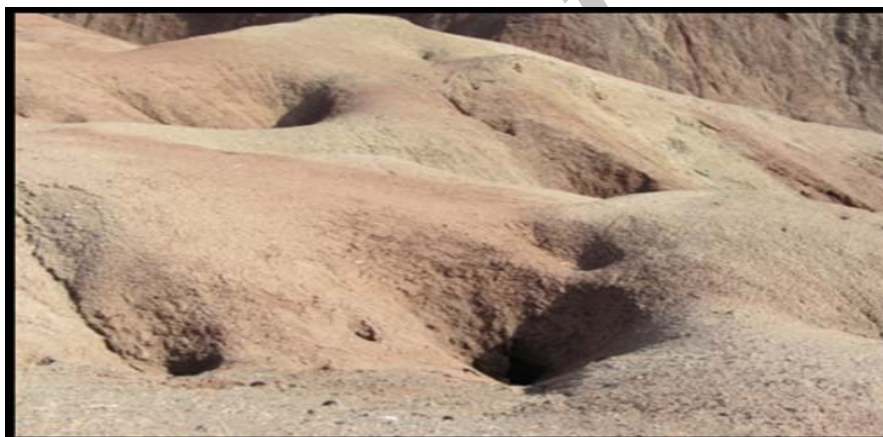
شکل (۷) پدیده پای پینگ در سطح گندهای نمکی