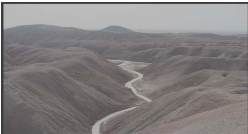
شکل (۶) رودخانه‌ی فصلی شور در دامنه‌های پشت به جاده