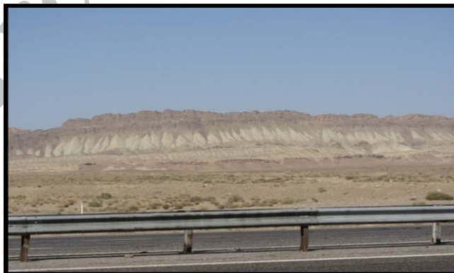
شکل (۳) بدلند و شیب های واریزه ای پیوسته در مجاورت آزاد راه قم - کاشان

موقعیت جغرافیایی: این ژئومورفوسایت در مختصات عرض جغرافیایی ۳۴ درجه و ۲۱ دقیقه شمالی و در طول ۵۱ درجه و ۱۴ دقیقه شرقی قرار گرفته است. خصوصیات ژئومورفولوژیک: این اشکال که نوعی بدلند نیز هستند، ناشی از تناوب رس و مارن در زیر و سازند سخت در بالا هستند که به صورت واریزه های کوچکی در پای دامنه به صورت متوالی و به هم پیوسته تشکیل شده اند. جاذبه ها و قابلیت های گردشگری: جاذبه های آموزشی از منطقه علاوه بر مشاهده ی زیبایی چشم اندازها، در زمینه ی شناخت فرایندهای دامنه ای از نمونه توان های ژئومورفوتوریستی این سایت می باشد.