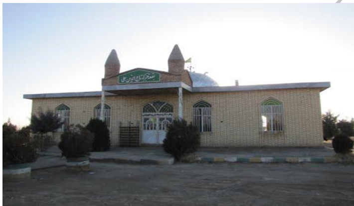
شکل (۲) زیارتگاه تاج الدین علی واقع در روستای قیچاق در دهستان مرحمت آباد شمالی

بازسازی آن با مساعدت شجاع الدوله حاکم مراغه در اواخر قاجار که به دست مردم منطقه بصورت بقعه‌ای چهارگوش با گنبد دوار از آجرپخته ساخته شده است (شکل ۲). زیارتگاه تاج الدین علی، مبین قدمت هزاران ساله است. بررسی‌ها نشان می‌دهد بطور متوسط ماهانه حدود ۲۴۰۰ نفر گردشگر از شهرها و روستاهای دور و نزدیک به این مکان مقدس مراجعه می‌کنند (اداره اوقاف شهرستان میاندوآب، ۱۳۹۲).