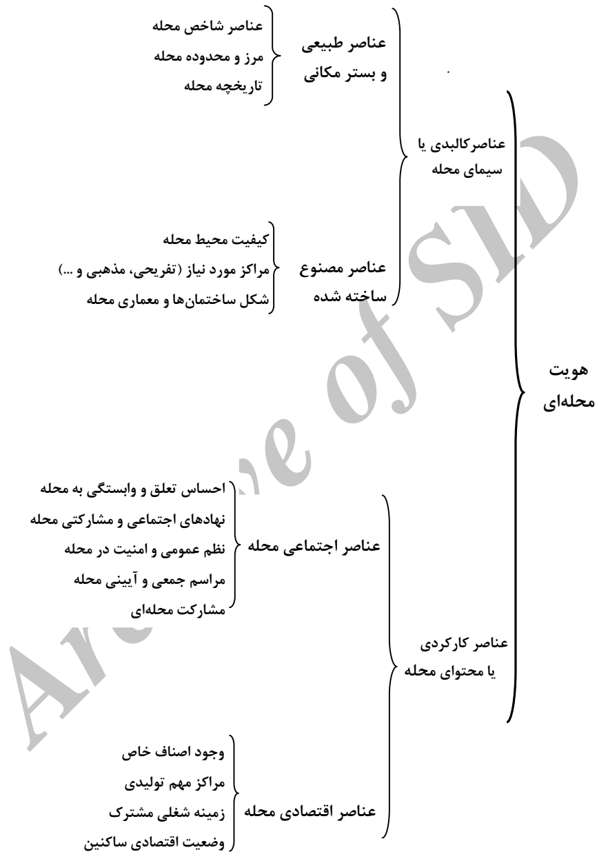
شکل (۱) مدل مفهومی پژوهش