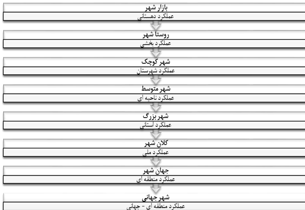
شکل (۲). انواع شهر از نظر اندازه و عملکرد فضایی

جغرافیدانان، شهر را محل تمرکز جمعیت، ابزار تولید، سرمایه، نیازها و احتیاجات و غیره می دانند که تقسیم کار اجتماعی نیز در آنجا صورت گرفته است و شهر را منظره‌ای مصنوعی از خیابانها، ساختمانها، دستگاهها و بناهایی می دانند که زندگی را امکان پذیر می‌سازد. بنابراین، شهر ترکیبی از عناصر مادی (مدنیت) و غیر مادی (اخلاقی) است که بخش دوم مهمتر است. (ربانی، ۱۳۸۷: ۱-۳).