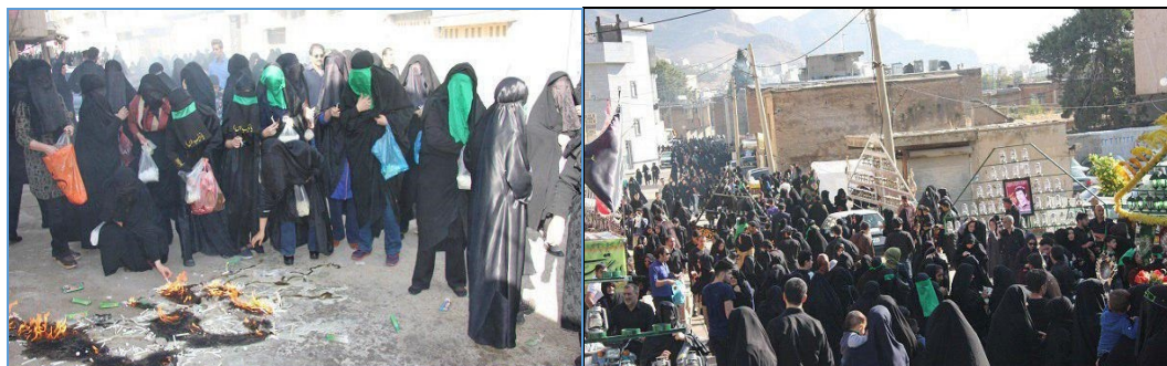
شکل (۱): افراد حاضر در مراسم چهل منبر شهرستان خرم‌آباد روز تاسوعای سال ۱۳۹۷