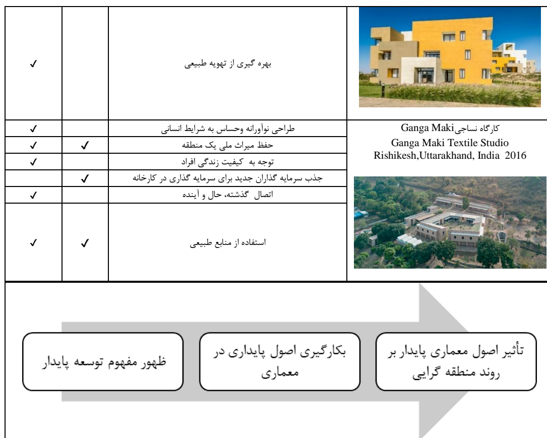
شکل (۳). فرایند تحول منطقه گرایبی پایدار

الکساندر زونیس و لیان لفور در آخرین چشم انداز خود در باب منطقه گرایبی، نمونه هایی از پروژه های اجرایی متفاوت در کشورهای مختلف دنیا را ذکر کرده و خاطر نشان می سازند که طی سال های واپسین قرن بیستم تا به امروز، تئوری معماری منطقه ای از منظرهای مختلف گرایش های زیادی گرفته و بسط یافته و با عملکرد خود نیز متناسب تر شده است. از تحلیل این آثار می توان به این نتیجه دست یافت که برخی از آثار منطقه گرایبی امروز از رویکرد پایداری تأثیر پذیرفته و دارای ویژگی های پایداری هستند. همچنین با بررسی سایر آثار که در مجلات و جوایز معماری که در سال های اخیر از آن ها با عنوان معماری منطقه گرا یاد شده می توان تاییدی بر نظریه زونیس و لفور در مورد ویژگی های منطقه گرایبی امروز باشد.