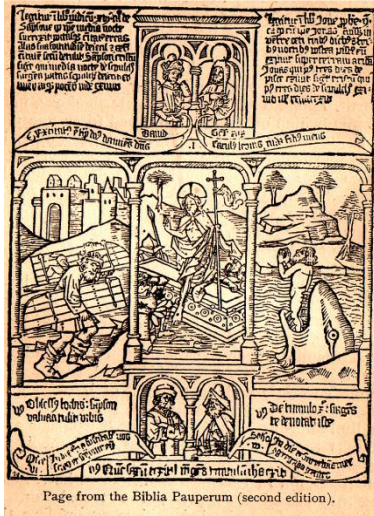
Page from the Biblia Pauperum (second edition).

برخی از قدیسان معتقد بودند که هنرمند اسیر دست شیطان است و دستاویز او یا فرزند اوست. اما کم کم کلیسا به روی هنرمندان گشوده شد و هنرمندان جایگاه رفیعی در آن یافتند. مینیاتور (طبیعت کوچک شده مصور) به صورت های مختلف آشکار شدند و بعد از آن به جایی رسیدند که دیوارها و سقف کلیساها منقش به تصاویر زیبای هنری شدند (تصویر ۲) هر چند این تصاویر خیال انگیز در اصل برای آن بود که مؤمنان بی سواد هم بتوانند جذب کلیسا شوند و هم با دیدن این تصاویر حکایت های دینی آنها را به پرسش بگیرند و به تأمل درآیند. اما این تصاویر جزء جدایی ناپذیر کلیسا شدند.