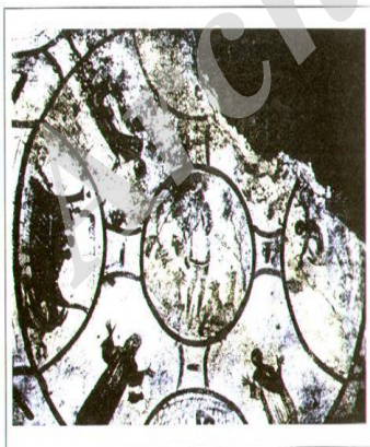
تصویر ۱. نمایی از نقاشی

نشانه در بحث ما نقش بسیار مهمی بازی می‌کند و بدون تعریف مفهوم آن، قادر نخواهیم بود به‌طور شایسته تفاوت واقعی میان زبان هنری و سخن مذهبی را مشخص کنیم. نماد و نشانه، دو مفهومی هستند که به‌زعم بسیاری از صاحب‌نظران در ساحتی دینی و با رویکردهای مذهبی شکل گرفتند و به تدریج به حوزه‌های غیردینی اشاعه یافتند. به نظر گادامر در عهد باستان، هنر وسیله بازنمایی حقایق عالم بود و آرام آرام از حقیقت دینی عبور کرد، اما تاریخ مسیحیت ارتباط تنگاتنگی با هنر و آثار هنری دارد و بنابراین شناسایی تاریخ هنر این دین، مسائل بسیاری را در جهان مسیحیت آشکار خواهد کرد.