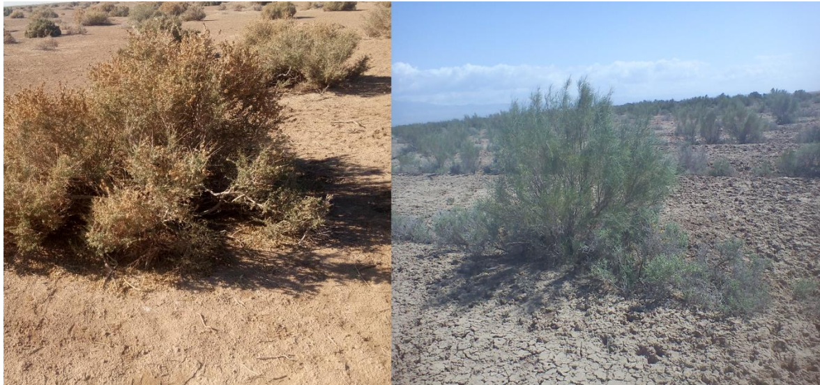
شکل ۲: گونه‌های کشت‌شده در منطقه‌ی مورد مطالعه

آتری پلکس ۲ و قره‌داغ ۳ بوده و نحوه‌ی کاشت گونه‌ها بر روی یک ردیف و به فاصله‌ی ۸ متر از ردیف کناری کشت است. آرایش کشت بر روی هر ردیف به صورت دو بوته‌ی آتری پلکس، دو گلدان تاغ و دو بوته‌ی قره‌داغ، به فواصل منظم چهارم‌تری است. تصاویری از گونه‌های کشت‌شده در منطقه در شکل ۲ نشان داده شده است.