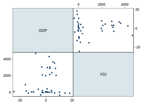
شکل ۲. پراکنندگی نرخ رشد سالانه GDP سرانه در مقابل جریان ورودی FDI

مدل‌های پویای مارکوف برای داده‌هایی با فرکانس یا فراوانی بالا مانند داده‌های روزانه، هفتگی و ماهانه مناسب هستند زیرا تعدیل سریع بعد از تغییر رژیم را ممکن می‌کند. همچنین مدل‌های خودرگرسیون مارکوف سوئیچینگ برای داده‌هایی با فراوانی پایین مانند داده‌های فصلی و سالانه و ... مناسب می‌باشند چون امکان تعدیل تدریجی بعد از تغییر رژیم را فراهم