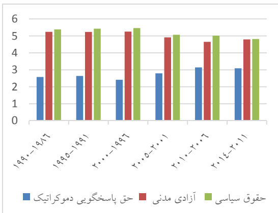
نمودار ۲. متوسط پنج ساله شاخص‌های دموکراسی مأخذ: یافته‌های تحقیق، پایگاه ICRG و موسسه آزادی

دو شاخص آزادی مدنی و حقوق سیاسی نیز که بوسیله مؤسسه آزادی ارائه می‌گردد نشان دهنده میزان دموکراسی در کشورهای مختلف می‌باشد. این شاخص‌ها بوسیله مقیاس ۱ تا ۷ اندازه‌گیری می‌شوند. مقیاس یک نشان دهنده بالاترین مقدار درجه دموکراسی و مقیاس ۷ پایین‌ترین درجه را نشان می‌دهد. مقدار متوسط شاخص حقوق سیاسی و آزادی مدنی به ترتیب در کشورهای مورد بررسی ۵/۱۳ و ۵/۱۹ می‌باشد.