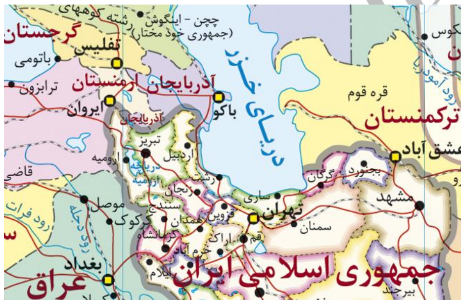
نقشه شماره ۱. نواحی مرزی جمهوری اسلامی ایران و آذربایجان

روز ۱۴ آذر ۱۳۴۹ هجری شمسی، پیرو عقد قرارداد تعیین انتظامات مرزی و تثبیت مرز جدید بین ایران و اتحاد جماهیر شوروی، اسناد علامت‌گذاری خطوط مرزی در دریاچه‌های پشت سد مخزنی ارس و سد انحرافی میل و مغان به امضا رسید.