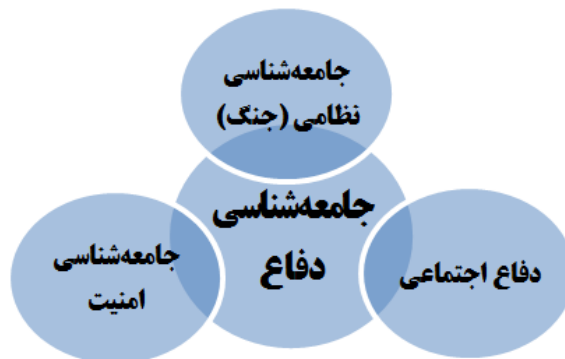
شکل شماره (۱): نسبت جامعه‌شناسی امنیت، نظامی (جنگ) و دفاع اجتماعی با جامعه‌شناسی دفاع

جامعه‌شناسی جنگ یا جامعه‌شناسی نظامی، تمامی ابعاد و زوایای مباحث مرتبط با امر دفاعی را در برنمی‌گیرد؛ به عبارت دیگر، هر کدام بخشی از واقعیت‌ها را بیان نموده و بخشی دیگر از مسائل را مورد توجه قرار نمی‌دهند. جامعه‌شناسی دفاع با دفاع اجتماعی نیز تفاوت دارد. دفاع اجتماعی به معنای مقاومت غیرخشونت‌آمیز جامعه در برابر تجاوز و تهاجم است که جایگزینی برای دفاع نظامی به‌شمار می‌آید. (Martin, 1993) این تعریف به‌خوبی بیانگر تمایزهای این دو گرایش می‌باشد. گفتنی است باوجود این اختلاف‌ها، برخی جنبه‌های تشابه نیز بین این گرایش‌ها وجود دارد؛ از جمله این تشابه‌ها می‌توان به نقش‌آفرینی عامل سرمایه اجتماعی در جامعه‌شناسی امنیت و جامعه‌شناسی دفاع، روابط غیرنظامیان و نظامیان بین جامعه‌شناسی نظامی و جامعه‌شناسی دفاع و وجود ویژگی‌هایی همچون اراده و روحیه در دفاع اجتماعی و جامعه‌شناسی دفاع اشاره کرد.