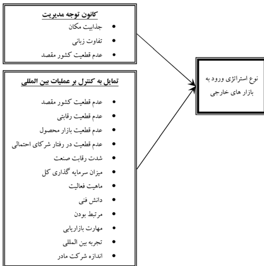
شکل ۱: مدل پژوهش