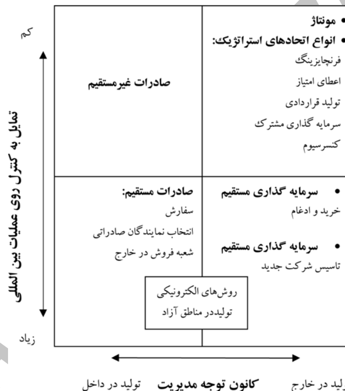
شکل ۴: دسته بندی جامع برای انواع استراتژی‌های ورود به بازار خارجی

نتایج متفاوتی دست پیدا کردند. بعضی اثر یک متغیر را مثبت و بعضی دیگر اثر همان متغیر را منفی بیان کردند و در این میان برخی نیز هیچ رابطه معناداری میان آن‌ها پیدا نکردند. بر این اساس تحقیق حاضر علاوه بر مرور نتایج تحقیقات گذشته مبنی بر شناسایی عوامل مؤثر در انتخاب استراتژی‌های ورود به بازارهای خارجی، اقدام به بررسی و دسته بندی این عوامل نموده و اثر این متغیرها را در شرکت‌های صادراتی صنایع غذایی استان