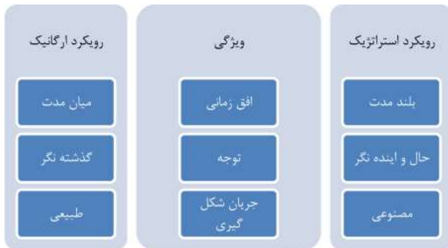
شکل ۲ مقایسه برندآفرینی ارگانیک و استراتژیک برای شهرها (یافته‌های پژوهش ۱۳۹۵)

توانند دارای اهداف، برنامه‌ها و منافع متعدد و گاه متضادی باشند. در این زمینه، یکی از مهم‌ترین اقدامات مدیران را می‌توان توجه به همسوسازی اهداف تأثیرگذاران با ذی‌نفعان با برنامه‌های مدیریت شهری در حوزه برندآفرینی شهر دانست. در این خصوص می‌توان از سه گروه ذی‌نفع سیاست‌گذار؛ ذی‌نفعان مجری و ذی‌نفعان بهره‌بردار نام برد.