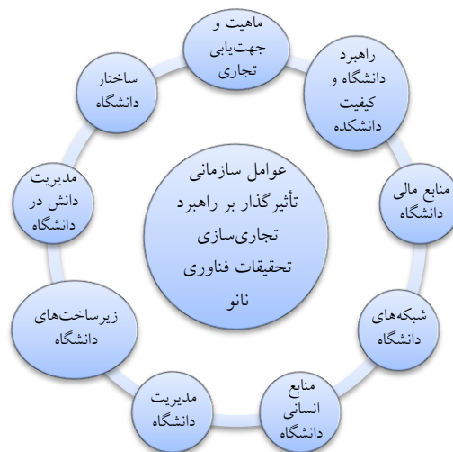
شکل ۲. چارچوب مفهومی عوامل سازمانی تأثیرگذار بر انتخاب راهبرد تجاری سازی تحقیقات فناوری نانو (محقق ساخته، ۱۳۹۳)

بعضی از عوامل سازمانی شناسایی شده در این تحقیق در پژوهش محققان دیگر مشاهده نمی شود. برای مثال منابع انسانی دانشگاه (مانند وجود نیروی انسانی خبره در حوزه فناوری نانو اعم از اعضای هیئت علمی و دانشجویان تحصیلات تکمیلی)، راهبرد دانشگاه (مانند راهبرد تجاری سازی و توسعه محصول) و شبکه های دانشگاه (مانند نفوذ و ارتباط دانشگاه در مراکز صنعتی و تصمیم گیری) که در این تحقیق به عنوان ابعادی از عوامل سازمانی مؤثر بر انتخاب راهبرد تجاری سازی تحقیقات دانشگاهی فناوری نانو شناسایی شده است، در یافته های محققان دیگر بیان نشده است. از آنجا که فناوری نانو یک فناوری نوظهور است، لذا تعداد کمی از متخصصان دانشگاهی در این حوزه تخصص دارند. بنابراین، وجود نیروی انسانی خبره مانند اعضای هیئت علمی و دانشجویان تحصیلات تکمیلی متخصص در فناوری نانو، عاملی مهم در انتخاب راهبرد تجاری سازی تحقیقات دانشگاهی در این حوزه محسوب می شود. همچنین، رویکرد سنتی آموزش صرف و تولید دانش بی توجه به ابعاد تجاری سازی آن، موجب ایجاد دغدغه و نگرانی محققانی است که به تجاری سازی یافته های تحقیقاتشان تمایل دارند. لذا وجود راهبرد تجاری سازی تحقیقات دانشگاهی در دانشگاه مخصوصاً درباره فناوری های پیشرفته و نوظهور، بر