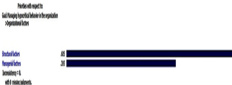
شکل ۳. مقایسهٔ زوجی عوامل مدیریتی و ساختاری با توجه به عامل سازمانی