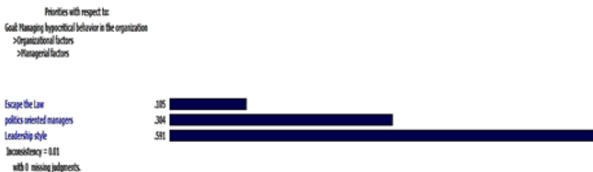
شکل ۵. مقایسه زوجی زیرشاخص‌های عامل مدیریتی با توجه به هدف سلسله‌مراتب

با توجه به شکل ۵، خبرگان در گروه عوامل مدیریتی مؤثر بر بروز رفتارهای ریاکارانه به‌ترتیب سبک رهبری و تصمیم‌گیری، سیاست‌پیشگی مدیران، و قانون‌گریزی را مؤثر می‌دانند. میزان ناسازگاری این مقایسه برابر با ۰/۰۱ و در بازه قابل قبول است.