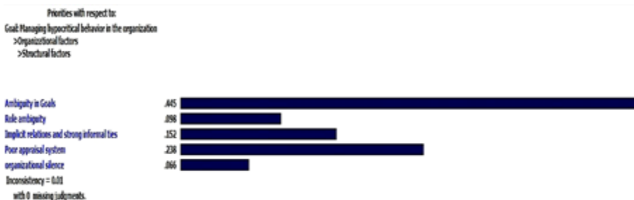
شکل ۶. مقایسه زوجی زیرشاخص‌های عامل ساختاری با توجه به هدف سلسله‌مراتب