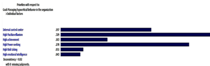
شکل ۴. مقایسه زوجی زیرشاخص‌های عامل فردی با توجه به هدف سلسله‌مراتب

با توجه به شکل ۴، خبرگان در گروه عوامل فردی مؤثر در بروز رفتارهای ریاکارانه به‌ترتیب ماکیاویلیسم بالا، قدرت‌طلبی بالا، مرکز کنترل درونی، توفیق‌طلبی بالا، ریسک‌پذیری، و هوش عاطفی بالا را دارای بیشترین تأثیر می‌دانند. میزان ناسازگاری این مقایسه برابر با ۰/۰۲ است که در بازه قابل قبول خواهد بود.