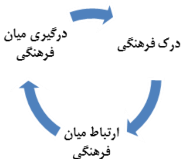
شکل ۱. ابعاد هوش فرهنگی

بر این اساس، مفهوم این مقاله از هوش فرهنگی (CI) شامل برخورد با پویایی‌های هوشی و بخش‌های غیرمنطقی به همراه برخوردهای میان‌فرهنگی و درک ابعاد و مهم‌تر از همه بُعد عملی است.