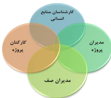
شکل ۱. چهاروجهی منابع انسانی بردین و سودرلوند، ۲۰۱۱

۱. مدیران صف: در ادبیات اخیر، به مدیران صف به عنوان بازیگران مهم اشاره شده است که مسئولیت ارزش‌آفرینی منابع انسانی در سازمان را عهده دارند.