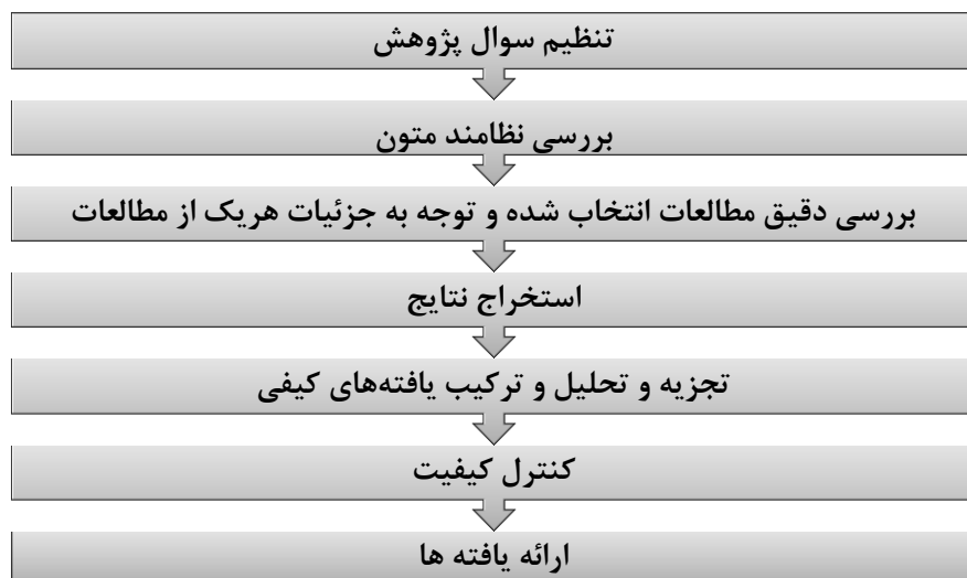
شکل ۱- گام‌های روش فراترکیب

این پژوهش با روش کیفی فراترکیب ۱ انجام شد. این روش برای ترکیب مطالعات کیفی مرتبط با یک پدیده و توصیف و تفسیر آن‌ها به کار می‌رود (Whittemore, 2005). فراترکیب، پژوهشی است که به ارزشیابی پژوهش‌های دیگر می‌پردازد. به عبارتی، مرور یکپارچه منابع یا مرور سامانمند نیست؛ هدف اصلی فراترکیب ساخت نظریه، حمایت از تئوری‌های موجود و تفسیر و روشن‌سازی و تکمیل آن‌ها است (Sandelowski & Barsoo, 2007). در حقیقت دیدگاه تفسیری فراترکیب عامل افتراق آن با فراتحلیل است. این رویکرد، روشی نوین برای گردهم آوردن، مقایسه و ترجمه مطالعات کیفی با یکدیگر است. در پژوهش‌های سازمانی از روش فراترکیب کمتر استفاده شده است. نمونه موردنظر در این پژوهش، از مطالعات کیفی منتخب و بر اساس ارتباط آن‌ها با سؤال پژوهش ساخته می‌شود. این پژوهش در دو مرحله انجام شد. درنهایت با توجه به انجام مراحل روش فراترکیب و همچنین تحلیل اسناد مرتبط و اخذ نظر خبرگان جهت بهینه‌سازی آموزش‌های سازمانی صنعت پتروشیمی، الگوی انطباقی ارائه گردید. در ادامه گام‌های روش فراترکیب با ابتناء بر روش ساندلوسکی و بارسو ۲ (۲۰۰۷) مطابق شکل شماره ۱ تشریح شده است.