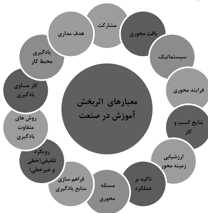
شکل ۲- معیارهای اثربخش جهت طراحی آموزش در صنعت

از بین ۲۵۰ مقاله ۳۰ مقاله مرتبط با موضوع تحقیق که الگوهای طراحی آموزشی و یادگیری محیط کار در آن توضیح داده بودند انتخاب شدند. معیار پذیرش شامل زبان فارسی و انگلیسی، زمان انجام مطالعه از سال ۱۹۸۰ به بعد، مقالات چاپ شده در مجلات و کتابها و داشتن حداقل سه معیار از چهارده معیار اثربخش جهت طراحی آموزش در صنعت بود (شکل شماره ۲ ببینید). این معیارها توسط تیم تحقیق دسته‌بندی گردیده‌اند.