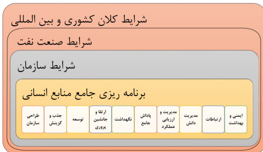
شکل ۲- چارچوب برنامه ریزی جامع منابع انسانی در سازمان های پروژه محور نفت و گاز (تنظیم از پژوهشگران)

همان گونه که اشاره شد، هدف از انجام این تحقیق شناسایی عوامل و ابعاد و ارائه چارچوبی برای برنامه ریزی منابع انسانی در سازمان های پروژه محور صنعت نفت و گاز بود. بر اساس مفاهیم و مقوله های استخراجی مشخص گردید که برنامه ریزان منابع انسانی در سازمان های پروژه نفت و گاز، برای حصول برنامه ای جامع که بتواند پاسخگویی نیازهای این سازمان ها باشد، بایستی ده زیرسیستم را در تعامل با یکدیگر برنامه ریزی نمایند، که مؤلفه های مربوط به هر زیرسیستم به طور تفصیلی در بخش یافته ها مورد بحث قرار گرفت. این برنامه ریزی بایستی با لحاظ کردن عوامل زمینه ای شرایط بین المللی، شرایط کلان کشور، وضعیت صنعت و شرایط سازمان صورت پذیرد. شکل چارچوب حاصل از این تحقیق را بطور خلاصه نمایش می دهد.