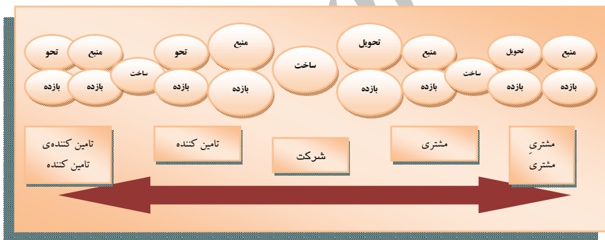
نمودار ۱. زنجیره خوشه‌ای تامین محصول

در نمودار شماره ۱ زنجیره عرضه‌کنندگان و مشتریان نشان داده شده است، که خود نیز با عرضه‌کنندگان و مشتریان دیگری مواجه هستند. در این میان، حلقه سه مرحله‌ای منبع، تولید و توزیع به صورت مستمر تکرار می‌شود.