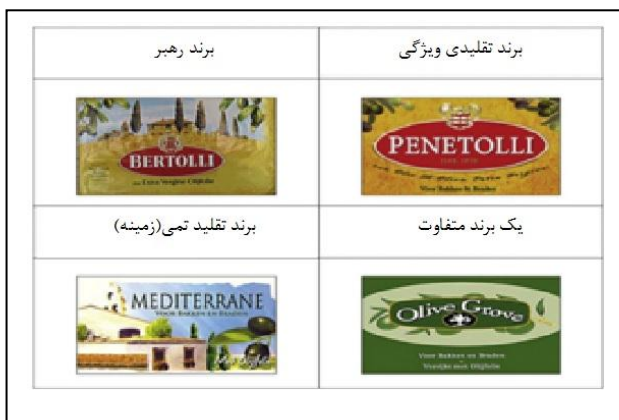
شکل ۲- نمونه ای از برند تقلیدی مبتنی بر ویژگی های ظاهری و برند تقلیدی مبتنی بر زمینه (تم) با توجه به برند پیشرو

پرسشنامه مورد استفاده شامل ۴۳ سؤال است که ۱۱ سؤال مربوط به متغیر برند تقلیدی است. همان طور که در شکل (۲) مشاهده می شود ضمن در نظر گرفتن یک برند رهبر تولیدکننده زیتون به نام برتولی، هر دو نوع برند تقلیدی و ویژگی و زمینه نیز آمده است؛ که تصویر مربوط به زیتون پنتولی نشان دهنده یک برند تقلیدی ویژگی و تصویر مربوط به زیتون مدیترانه نشان دهنده یک برند تقلیدی مفهومی (زمینه) است. همچنین تصویر مربوط به زیتون اولیو گرو یک برند متفاوت در بازار را نشان می دهد. این سؤال یکبار با توجه به برند تقلیدی ویژگی و یکبار با توجه به برند تقلیدی زمینه ای توسط مشتریان سوپرمارکت های بزرگ پاسخ داده شده است. همچنین ۱۸ سؤال مربوط به اخلاق مصرف کننده و ۳ سؤال مربوط به اجتناب از برند را پاسخ داده اند.