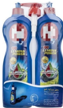
شکل ۲- محصول طراحی شده تحقیق

جامعه آماری تحقیق شامل تمام مشتریان فروشگاه شهروند منطقه ۶ (فروشگاه فروشگاه جلال آل احمد و بیهقی) بوده است. در این منطقه این شعبه فروشگاه شهروند مورد بررسی قرار گرفت. از آنجا که در تحقیق حاضر از طرح آزمایشی عاملی و سناریوسازی بازی نقش به عنوان استراتژی اجرایی پژوهش استفاده گردید، تعداد نمونه برای تحقیق با توجه به معیار وجود ۴۰ نمونه برای هر کدام از سناریو و وجود ۴ سناریو در این مطالعه ۳۲۰ نفر تعیین شد. جهت نمونه گیری، روش نمونه گیری غیر احتمالی «نمونه در دسترس» استفاده گردید. ابزار مورد استفاده در پژوهش حاضر پرسشنامه است، پرسشنامه پژوهش حاضر بر اساس راهنمایی‌های اساتید خبره و متخصص در این حوزه طراحی شده است. پرسشنامه مورد استفاده از دو قسمت تشکیل شده است. قسمت اول پرسشنامه شامل سوالات جمعیت شناختی (جنسیت، تحصیلات، سن و...) است و قسمت دوم آن که بخش اصلی پرسشنامه را تشکیل می‌دهد، سوالات مرتبط با متغیر قصد خرید با توجه به تصویر محصول مایع ظرفشویی ارائه شده به خریداران شامل ۴ سوال (برای محصولی که به صورت تکی با تخفیف ارائه می‌شود) و یا ۵ سوال (برای محصولی که به صورت بسته دو عددی با تخفیف ارائه می‌شود) می‌باشد؛ برای پاسخ به سوالات از طیف لیکرت ۵ تایی استفاده شده است، که گزینه‌های آن عبارتند از: کاملاً مخالف، مخالف، نه موافق و نه مخالف، موافق و کاملاً موافق.