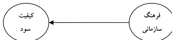
شکل ۲- رابطه فرضی بین فرهنگ سازمانی و کیفیت سود