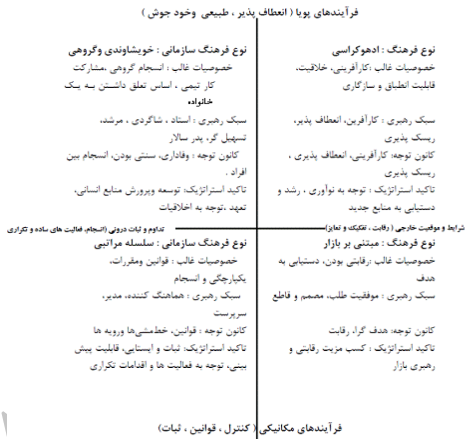
شکل ۱- مدل فرهنگ سازمانی کمرون و فریمن (۱۹۹۱) (Lund, 2003)

کارها توسط کارکنان متأثر از میزان نگرانی شغلی آنها و کسب منافع و رضایت شخصی می باشد. همچنین مفروضات تئوری نمایندگی از جمله حداکثر سازی منافع شخصی و فرد گرایی در جامعه آماری مورد بررسی تأیید نشده و جامعه آماری بر جمع گرایی و حفظ منافع گروه تأکید دارد. از تحقیق رویایی و عبدلی (۱۳۸۷) چنین استنباط می شود که شاید فرهنگ سازمانی بر کیفیت سود نیز تأثیر گذار باشد لذا در تحقیق حاضر، رابطه فرضی بین فرهنگ سازمانی و کیفیت سود در شکل ۲ به عنوان فرضیه مورد بررسی قرار گرفته است.