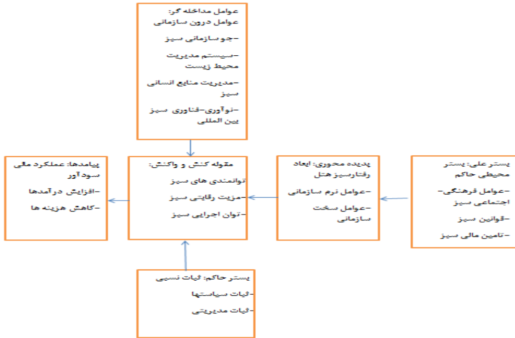
شکل شماره ۱: مدل پارادایمی رفتارهای سبز هتل و عملکرد مالی (مطابق با طرح نظام مند اشتراوس و کوربین)

LISREL8.8 تحلیل عاملی تاییدی اجرا گردیده و سپس با توجه به نتایج به دست آمده تمامی شاخص های مربوط به متغیرهای پژوهش که مقادیر بار عاملی آن ها کمتر از ۰.۴ بود حذف شدند و مدل اصلاحی