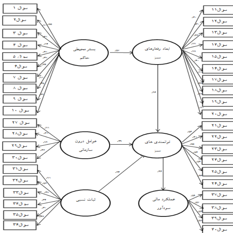
شکل ۲- ضرایب استاندارد شده مسیره های مربوط به فرضیه های پژوهش