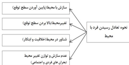
نمودار (۲) نحوه تعامل میان فرد و محیط

در این دیدگاه ها ضمن پذیرش ذهن و عین به عنوان او وجود مستقل از هم و حتی در تقابل باهم بر سرانگنه ذهن سازنده عالم خارج یا عالم خارج سازنده ذهن است مجادله است. رفتار فرد و جامعه از نحوه تعامل با دیگران و محیط شکل می گیرد و به این سبب نیاز ارتباط با پدیدار شناسی روشن می شود.