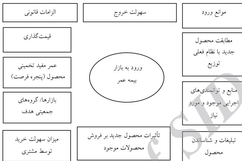
شکل ۱. عوامل مؤثر بر ورود یا ارائه محصول جدید به بازار بیمه عمر