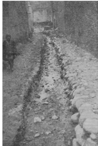
یکی از کوچه‌ها پیش از اصلاحات شهری