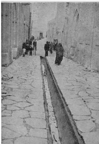
همان کوچه‌ها بعد از اصلاحات شهری

(گزارش مشروح مبارزه با بیماری تراخم، ۱۳۳۱، ص ۱۶۴)