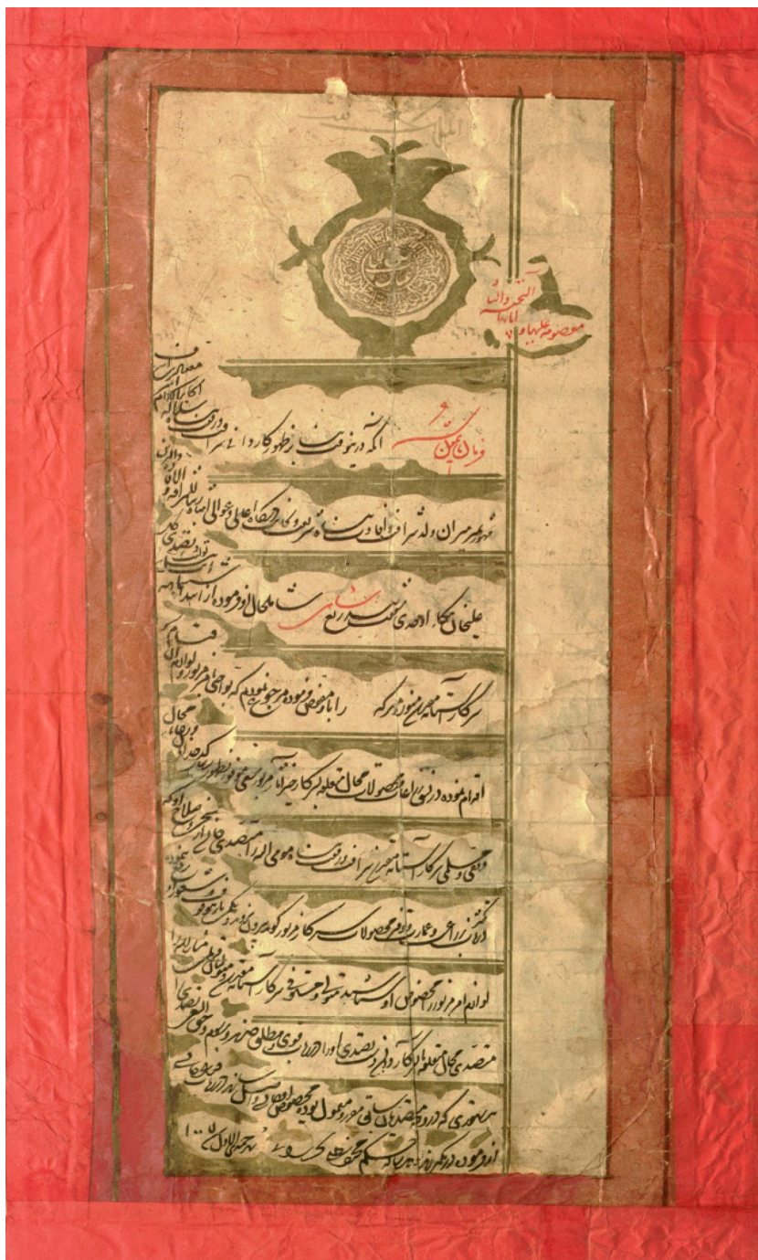
تصویر ۱ فرمان تولیت شاه عباس