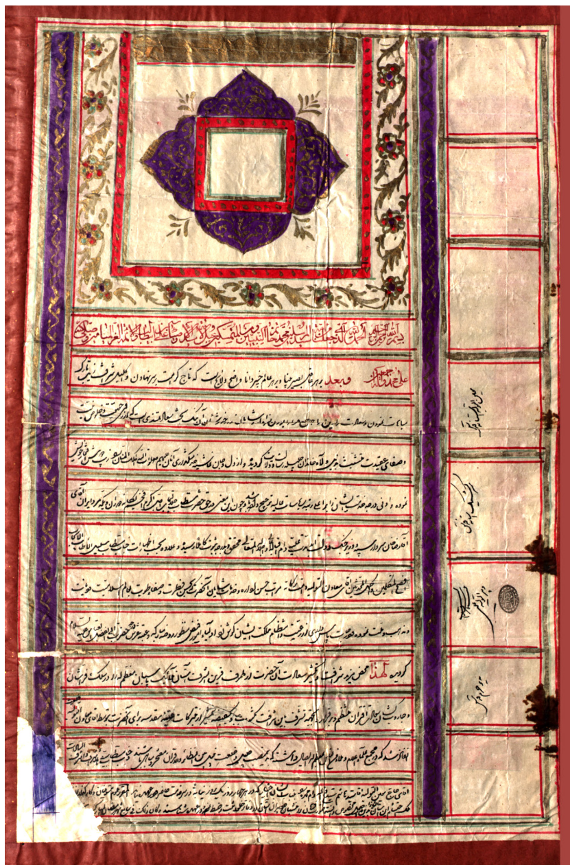
تصویر ۳ فرمان تولیت احمدشاه برای رضاخان سردار سپه