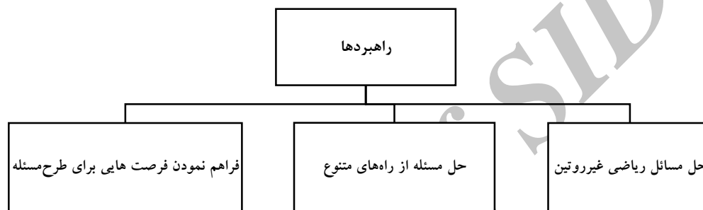
شکل ۱: زیرمقوله‌های اصلی مقوله راهبردها

برای شکل‌گیری تجربه‌هایی در زمینه ارائه راه‌حل‌های خلاقانه در حل مسائل ریاضی، به اجرای راهبردهای خاصی در جهت تقویت این امر مهم نیاز است. براساس دیدگاه مشارکت‌کنندگان، این راهبردها شامل زیرمقوله‌های حل مسائل غیرمعمول، حل مسئله از راه‌های متنوع و فراهم کردن فرصت‌هایی برای طرح مسئله است (شکل ۱)، که در سؤال دوم پژوهش براساس صحبت‌های مشارکت‌کنندگان مستند خواهد شد.