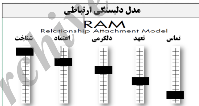
شکل ۱. مدل تصویری دل‌بستگی ارتباطی (RAM)

یکی از برنامه‌هایی که در زمینه آموزش پیش از ازدواج بکار بسته می‌شود، برنامه آگاهی و انتخاب‌های میان فردی پیش از ازدواج ۴ (PICK) است. این برنامه بر پایه مدل دل‌بستگی ارتباطی ۵ (RAM) به دست وان اپ (۲۰۰۶) به‌عنوان مدلی برای بررسی روابط نزدیک گسترش یافت. این مدل نظری شناساننده نگاره پیوندهای ارتباطی در یک رابطه است. همان‌طور که در شکل ۱ نشان داده شده است این برنامه دربرگیرنده پنج مؤلفه شناخت، اعتماد، دلگرمی، تعهد و تماس ۶ است. آمیخته‌ای از این پنج پیوند ارتباطی، نگاره‌ای از دریافت کلی در یک رابطه و اطلاعات معنی‌داری درباره احساس عشق، دل‌بستگی و نزدیکی در رابطه فراهم می‌کنند.