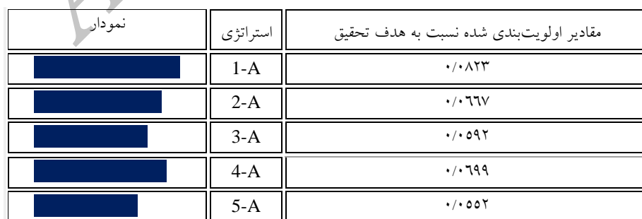
جدول ۵. اولویت استراتژی‌های توسعه‌ی گردشگری پایدار استان لرستان