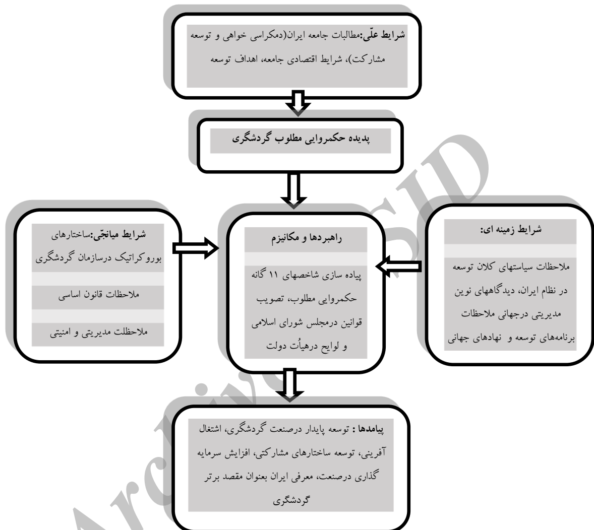
شکل ۲: الگوی مفهومی حکمروایی مطلوب در گردشگری ایران

شرایط علی، براساس مدل مفهومی توسعه یافته و ابعاد آن، پدیده الگوی حکمروایی مطلوب گردشگری، منوط به درک درست شرایط علی وضعیت موجود و زمینه‌های پیدایش آن در صنعت گردشگری است. در صورتی که این شرایط بصورت اصولی درک نشوند. همانند؛ سایر رویکردها و شیوه‌های مدیریتی بصورت مقطعی و به صورت یک مد کوتاه مدت اجرائی شده و سپس از رونق می‌افتند. در این الگو، شرایط علی و شاخص‌های و مکانیزم‌های اجراء