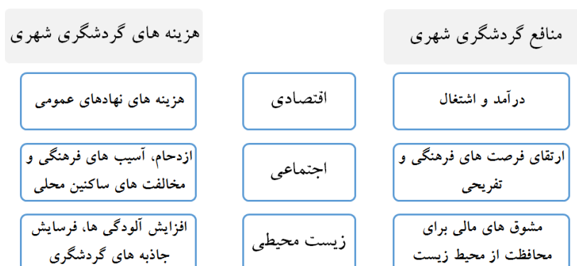
شکل ۱. منافع و هزینه‌های اقتصادی، اجتماعی و زیست‌محیطی گردشگری شهری برگرفته از (هیلی، ۲۰۱۱)

اشاره می‌کنند که گردشگری به‌عنوان مولد اشتغال، طیف گسترده‌ای از خدمات مورد نیاز گردشگران را در قالب فعالیت‌های جدید شهری به وجود می‌آورد. در این رابطه اشوورث و پیچ (۲۰۱۱) از مهم‌ترین خدمات گردشگری شهری به مراکز خرده‌فروشی و فروشگاه‌های زنجیره‌ای، رستوران‌های پذیرایی، هتل‌ها اشاره می‌نمایند. گردشگری شهری علاوه بر اثرات سازنده، اثرات منفی متنوعی را نیز بر ابعاد اقتصادی، اجتماعی، سیاسی و زیست‌محیطی شهر تحمیل می‌نماید (ابراهیم‌نیاسماکوش و همکاران، ۱۳۹۲؛ تقوایی و صفرآبادی، ۱۳۹۰؛ تیموری، ۱۳۹۴؛ حاتمی‌نژاد و همکاران، ۱۳۹۳؛ رضایی نیا و جعفری، ۱۳۹۴؛ قدمی، ۱۳۹۰؛ مؤمنی و همکاران، ۱۳۸۷؛ نوروزی، ۱۳۸۶). هیلی (۲۰۱۱) با ارزیابی هزینه‌های اقتصادی به‌سنجش اثرات گردشگری شهری بر سرمایه عمومی می‌پردازد این محقق هزینه‌ها و منافع گردشگری شهری را به‌طور خلاصه دسته‌بندی نموده که در شکل ۱ ارائه شده است: