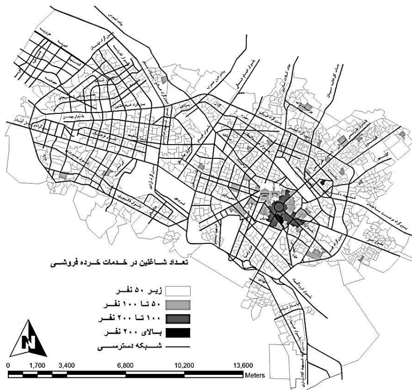
شکل ۶. پراکنش فضایی خدمات خرده فروشی