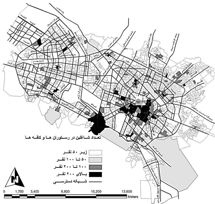
شکل ۵. پراکنش فضایی رستوران ها و کافه ها